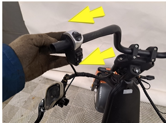
Ota vasen kahvarunko pois.