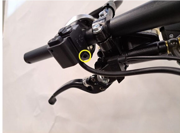
Löysää vasemman kahvarungon kiristysruuvia. (kuusiokoloavain 3 mm).