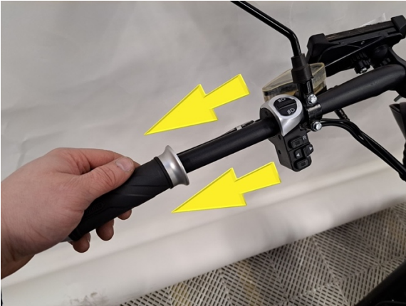
Irrota vasen kahva.