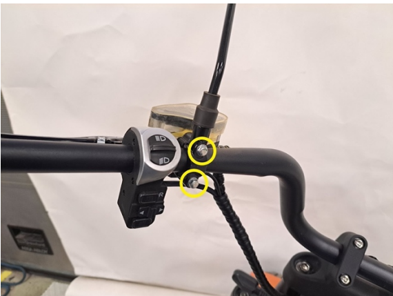
Irrota vasemmanpuoleisen jarrusylinterin. kiinnityspultti. (kiintoavain 8 mm).